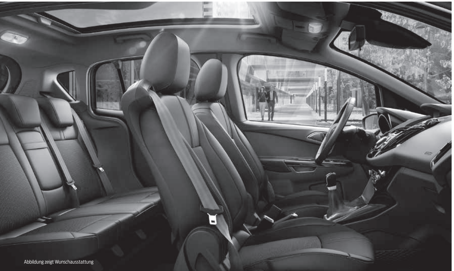
Abbildung zeigt Wunschausstattung